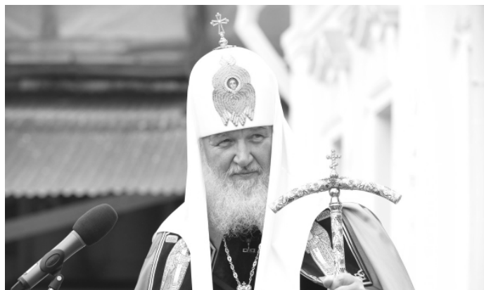
Святейший Патриарх Московский и всея Руси Кирилл

Страница Святейшего Патриарха «ВКонтакте»